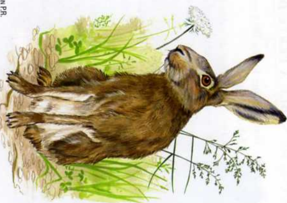
L'ÈVRE / DESSIN PR.