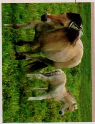
JUMENT ET POULAIN HENSON

Cheval de la baie de Somme, le Henson est « né » en 1975 du croisement de juments de selle françaises et anglo-arabes avec des poneys fard d'origine norvégienne. La race Henson se caractérise par un caractère sociable remarquable et des performances de rusticité, d'endurance, de maniabilité, d'agilité et de rapidité. Bien charpenté, pas trop lourd, le Henson mesure de 1,50 m à 1,60 m au garrot. Sa robe est isabelle, avec des variations plus ou moins foncées et une longue raie noire sur l'échine. C'est une monture de loisir, très adaptée à la randonnée, apte toutefois à la pratique de la compétition d'attelage, horse-ball et polo-cross. Elevés de manière